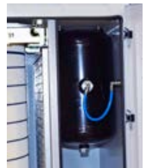
Calderín de aire comprimido para limpieza del filtro