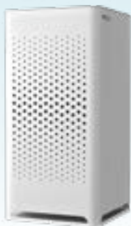
City M Luftrenare

City M luftrenare. City M kommer med både ett 99,95% HEPA-filter samt ett molekylärt filter för föroreningar i gasform.