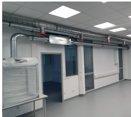
Das Digestorium in der Bauphase. Hier wird die Luft über einen Luftreiniger CC 400 abgesaugt und über die angeschlossene Rohrleitung der RLT-Anlage sicher nach außen geführt.

Weil die Raumluft im Labor mit Schadstoffen belastet sein kann, war es dringend erforderlich, eine Überströmung in andere Räume zu verhindern. Für den dafür erforderlichen leichten Überdruck hatte Camfil eine smarte Lösung: Die installierten Luftreiniger CC 2000 werden mit einer Zeitschaltuhr nach einer kurzen zeitlichen Differenz gestartet. Dadurch wird ein leichter Überdruck im Labor erreicht. Das gleiche passiert auch mit dem CC 400 der mit dem Digestorium gekoppelt ist. Er schaltet sich ein, wenn das Digestorium in Betrieb geht. Somit ist auch dieser Bereich automatisch gesichert.