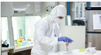
Im SYNLAB-Testlabor in Weiden werden täglich Testungen durchgeführt.

Deutschlandweit führt das SYNLAB-Team unter anderem PCR-Tests und Antikörper-Tests für Testungen auf SARS-CoV2 durch. Das SYNLAB-Netzwerk ermöglicht es, auch schwächer abgedeckte Regionen in Deutschland zu betreuen.