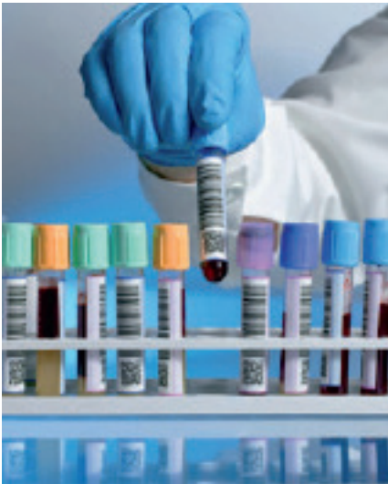
Im Digestorium werden Reagenzien vorbereitet.

Das Digestorium ist ein wichtiger Bestandteil im Testlabor. Hier werden Reagenzien vorbereitet. Beim Umgang mit flüchtigen Gefahrstoffen oder Aerosolen steht der Schutz der Mitarbeiter an erster Stelle. Deshalb wird hier die Luft über einen CC 400 abgesaugt, H13 gefiltert und über die angeschlossene Rohrleitung nach außen geführt.