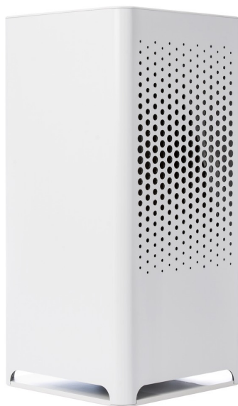
Luftreiniger City M

Das Infektionsrisiko im Klassenzimmer sinkt, wenn stationäre Luftreiniger mit integrierten Hochleistungsfiltern aufgestellt werden. Camfil hat eigenständige, robuste Luftreiniger aus der City Serie entwickelt. Durch das Umluftverfahren, bis zu einer 6-fachen Luftwechselrate / Stunde, wird die Rauminnenluft durch die Luftreiniger permanent gereinigt. Die in den Aerosolen befindlichen Viren werden über Hochleistungsfilter (HEPA Filter, H14), deren Wirksamkeit bei einer Partikelgröße von 0,06 bis 0,1 \mu bei einer Abscheideleistung von 99,995 % liegt, herausgefiltert. Die Luftreiniger der City Serie sind leise, da sie speziell für den Einsatz in Büro- oder Klassenräume konzipiert worden sind.